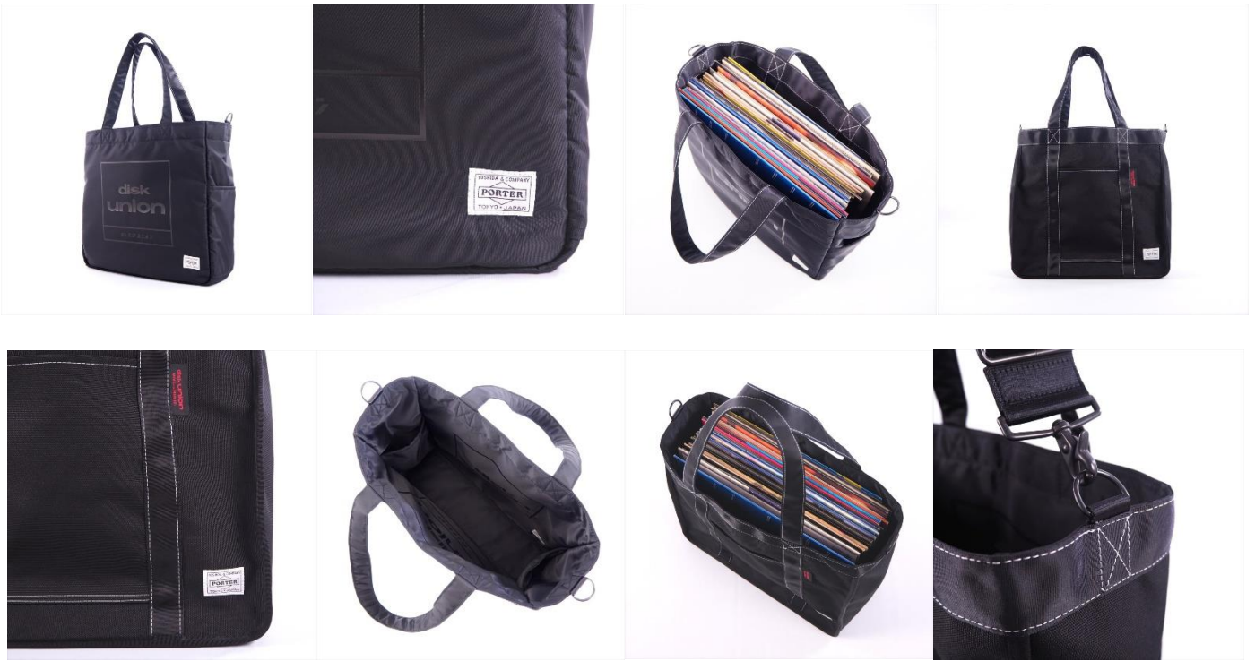
PORTER x diskunion 限定コラボレーションモデル 2WAY 7inch RECORD BAG 34,500 (+税)